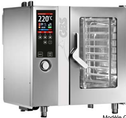
Modèle GBS FX122G3